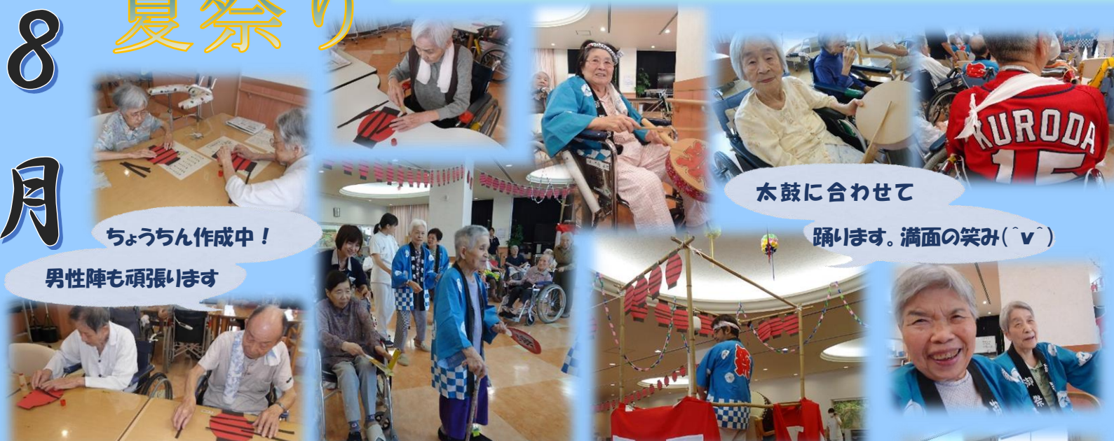
ちょうちん作成中！ 男性陣も頑張ります