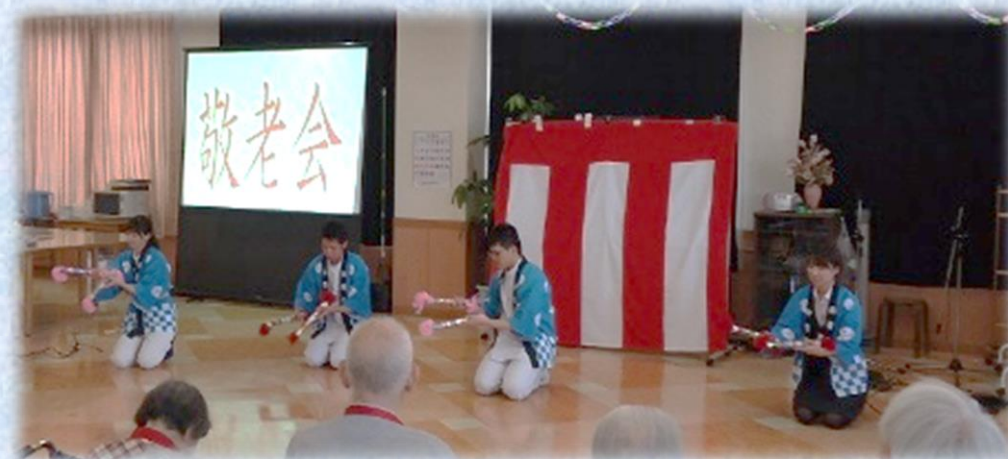
職員による銭太鼓を鑑賞する入所者の方