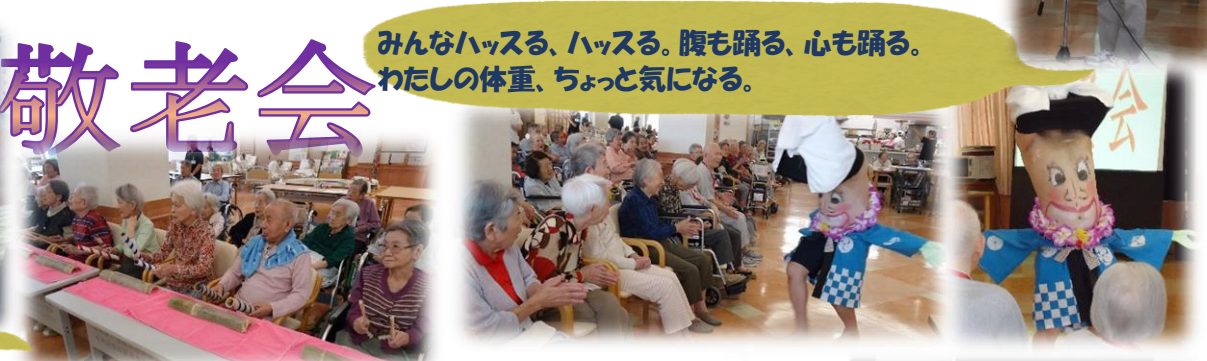
みんなハッスル、ハッスル。腹も踊る、心も踊る。 わたしの体重、ちょっと気になる。