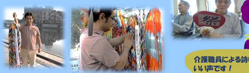
介護職員による詩吟の披露。 いい声です！

こちらも毎年恒例。 皆さんに折って頂いた千羽鶴を、リハビリ職員が平和公園に奉納しています。